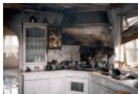
Figuur 2 - Voorbeelden van enkelvoudige woningbranden.

Het model richt zich in eerste instantie op brandincidenten van enkelvoudige woningbranden (zie figuur 2) van het type klein en middelgroot. Ondanks het feit dat de grote enkelvoudige woningbranden niet zijn meegenomen in de modelontwikkeling, heeft het