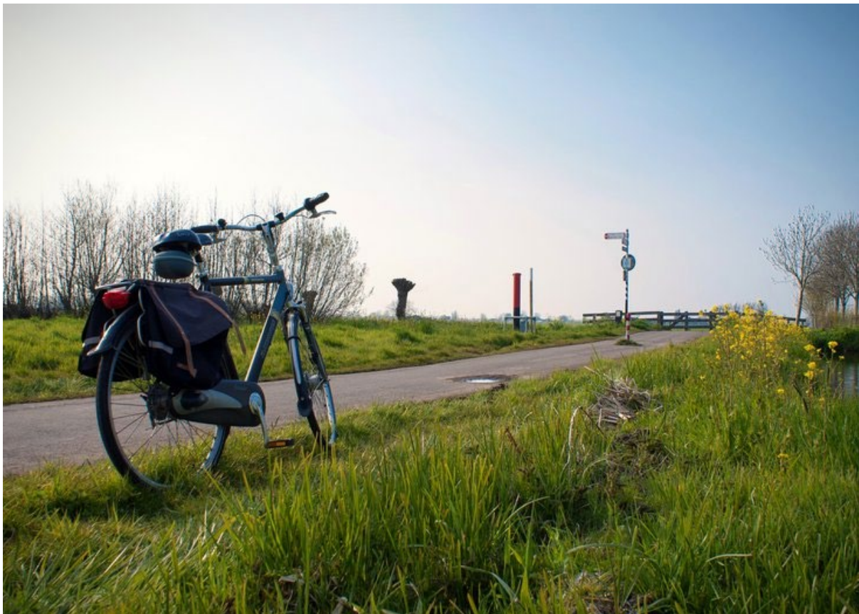
Delfland Richard Haddeman (bron: pixabay.com )

Alvorens instrumenten in te zetten en arrangementen te ontwikkelen voor de bekostiging van groenblauw is het derhalve van belang afwegingen te maken. Welk doel dient het groenblauw, wie heeft het vruchtgebruik, gaat het om ontwikkeling en/of beheer, wat is de toegevoegde waarde en kunnen we prioriteren? De gezamenlijke overtuiging dat groenblauw meerwaarde heeft, is het fundament onder de samenwerking bij de financiering en bekostiging ervan. Die meerwaarde kan voor de één een gezonder leefklimaat zijn, voor de ander een bijdrage aan het vestigingsklimaat of het omgaan met klimaatverandering. Betrek aan de voorkant de relevante publieke, private en maatschappelijke partners om die meerwaarde in beeld te brengen.