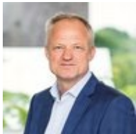
Door Co Verdaas