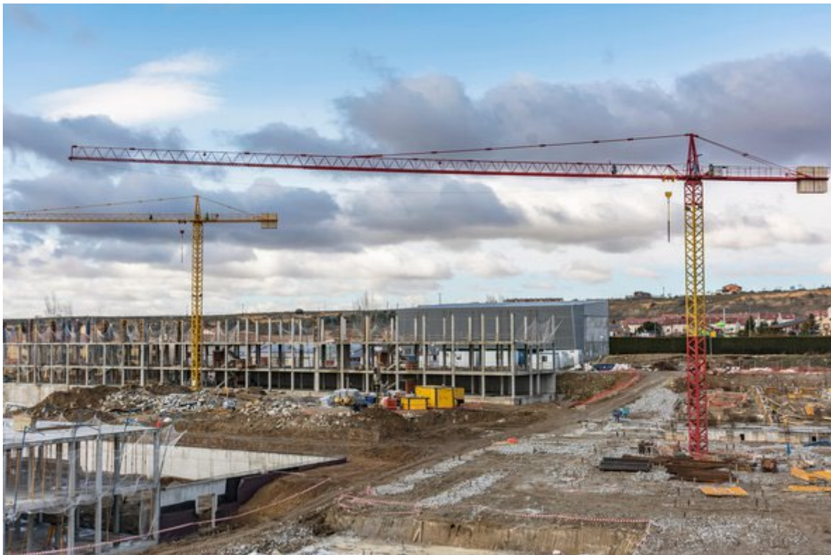
'Bouwplaats' door Juan Enrique del Barrio (bron: Shutterstock )

Vindt de gemeente woningbouw inderdaad doorslaggevend dan is onteigening de enige dwingende mogelijkheid om door te zetten. Immers, eigenaren kunnen niet gedwongen worden grote bedragen te investeren in het bouwen van woningen als ze dat (nu nog) niet willen. In de praktijk zullen zij hierop anticiperen, wanneer het hen duidelijk wordt dat de gemeente doorzettingsmacht gaat gebruiken. Men probeert dan vaak alsnog minnelijk tot een overeenkomst te komen.