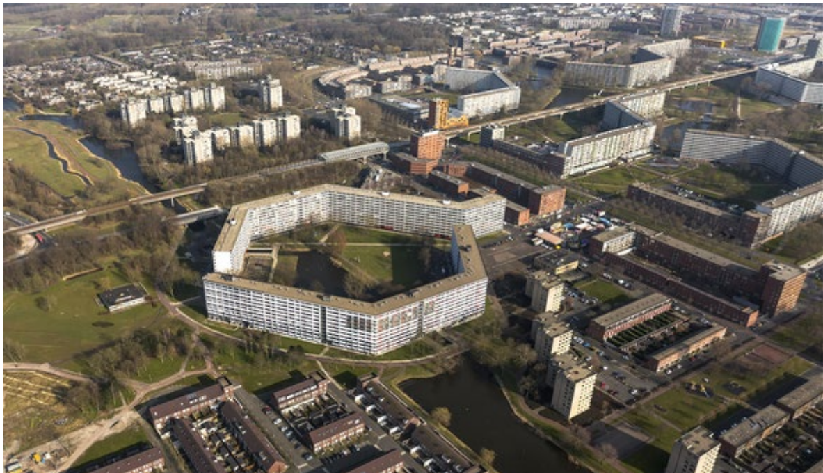
Honingraatflats de Bijlmer - Amsterdam'

Ten derde de sturing. Helaas herhaalt de pijnlijke geschiedenis van het wijkenbeleid zich. Er wordt van bovenaf een ingewikkelde en tijdrovende bestuurlijke structuur opgelegd. De toverwoorden zijn interdepartementale werkgroepen, ‘alliantie-overleggen’, programmabureaus en een ‘deugdelijk monitoring- en verantwoordingssysteem’.