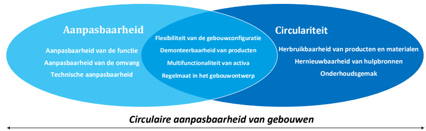
FIG. 16.1 Determinanten van circulaire aanpasbaarheid van gebouwen volgens Hamida et al. (2023b) Bron: Hamida et al. (2023b)