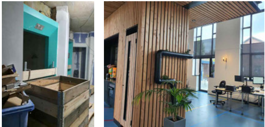
FIG. 16.7 Voorbeelden van reparatie van oude bouwproducten en behoud van monumentale elementen in twee transformatieprojecten

Reparatie van oude bouwcomponenten en het behoud van monumentale elementen zijn al toegepast in twee circulaire transformatieprojecten (Hamida et al. , 2023a). In casestudy 3 zijn er oude liften gerenoveerd (fig. 16.7 links). In de tot kantoor getransformeerde gymzaal (casestudy 4) is de vloer bewaard (fig. 16.7 rechts).