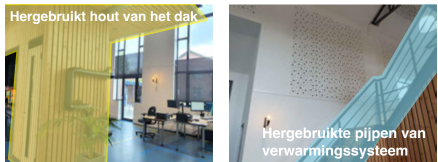
FIG. 16.6 Tweedehands bouwproducten hergebruikt voor andere toepassingen bij de transformatie van gymzaal naar kantoor in Bodegraven

Operationele strategieën zijn belangrijk voor de ondersteuning van herbruikbaarheid en recycling van producten en materialen (Hamida et al. , 2023b). Vijf operationele strategieën die herbruikbaarheid bevorderen zijn: implementatie van materiaalpaspoorten, inkoop van bouwproducten als een dienst, het ‘terugsturen’ van oude materialen voor hergebruik/recycling, hergebruik van oude producten voor een ander gebruik, en uitwisseling van producten. Behalve toepassing van de eerste strategie (implementatie van materiaalpaspoorten), hebben we voorbeelden gevonden van toepassing van de vier andere strategieën in verschillende transformatieprojecten (Hamida et al. , 2023a). Verschillende tweedehands bouwproducten zijn hergebruikt voor andere toepassingen bij de transformatie van een gymzaal naar kantoor (casestudy 4) (fig 16.6). De pijpen van het verwarmingssysteem zijn hergebruikt als trapleuning, terwijl het hout van het dak is hergebruikt in de constructie van een kleine tussenverdieping en in afwerkingen (fig. 16.6). Ook is hout van het dak hergebruikt in meubilair. In casestudy 4 is de vloerisolatie hergebruikt van een eerder project.