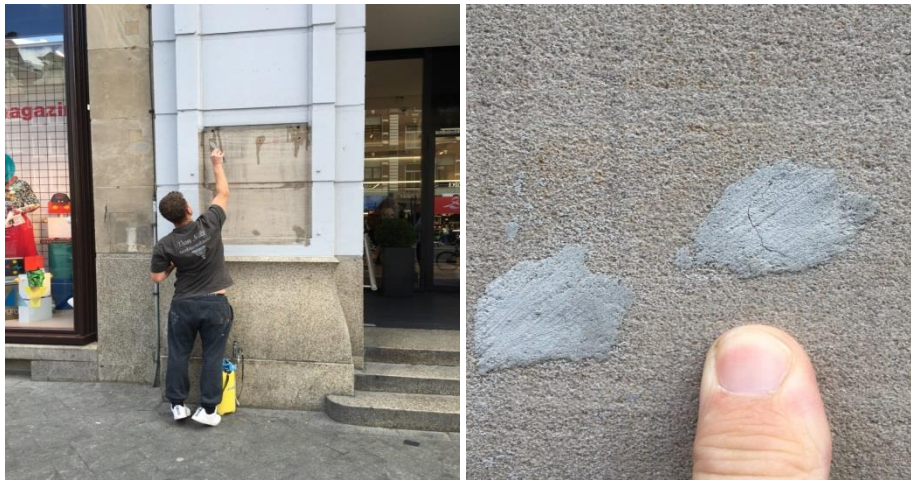
Fig. 1. Steenreparatie: meer dan het vullen van gaatjes in natuursteen.

Steenreparatie heeft zich ontwikkeld van het eenvoudig vullen van gaatjes (Fig. 1) tot een specialistische conserveringstechniek.