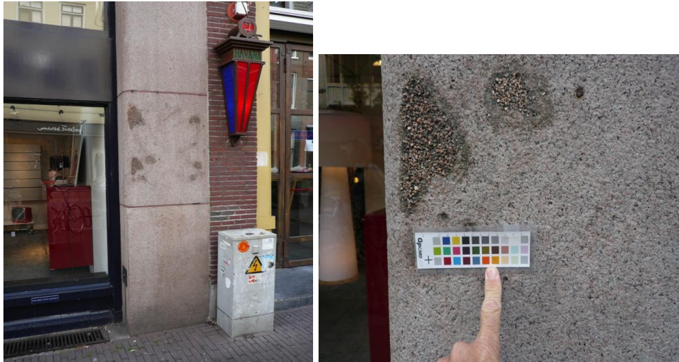
Fig. 5. Natuursteenreparatie: manifesteert zich op afstand als vlekken, van nabij als verschil in kleur en textuur ten opzichte van het oorspronkelijk materiaal (graniet).