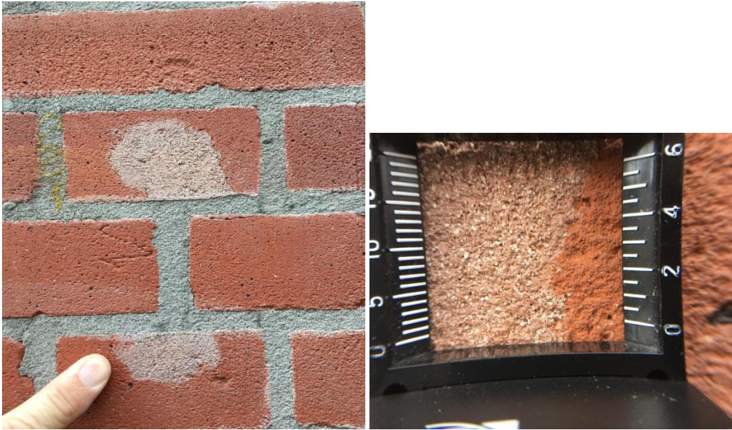
Fig. 3. Baksteenreparatie. Detail van de aansluiting.