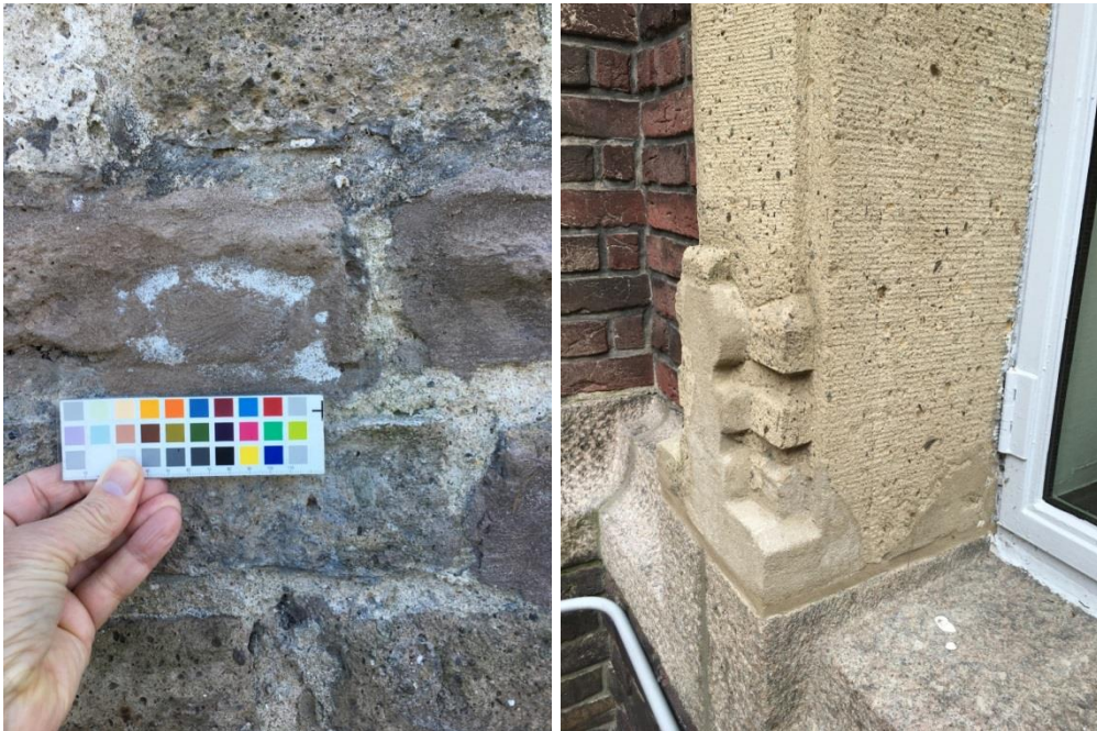
Fig. 6. Reparatie van tufsteen. Links: zowel qua kleur als textuur weinig geslaagde toepassing. Rechts: afwijkende textuur.