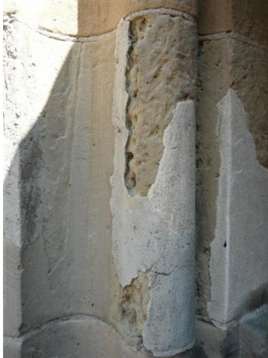
Fig. 7. Natuursteenreparatie; na enige tijd is scheurvorming en onthechting opgetreden (zandsteen).