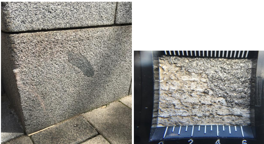
Fig. 2. Natuursteenreparatie. Detail van de aansluiting.

In de figuren hieronder komt een aantal van de gesignaleerde problemen aan de orde.