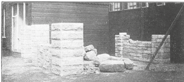
C.01 Foto van de stand van P. Schunck op de jaarbeurs van 1918. Op de achtergrond één van de standaard monsterkamers en op de voorgrond de eigenlijke stand met diverse muurtjes in Kunrader kalksteen en grote losse blokken. (uit Klein & Van Rummelen 1925a, p. 149).

Bouwmaterialen bleven een categorie bij de Utrechtse Jaarbeurs, maar toch vond de Eerste Nederlandse Tentoonstelling van Bouwmaterialen van 10 april tot en met 19 april 1931 plaats in Maastricht (ENBOUTEM, C.03). De secretaris van het bestuur, mr. Gielen, verwoorde het doel van de tentoonstelling als volgt: "Een centraal overzicht te geven van al wat Limburg op bouwgebied behoeft en van al wat Nederland te bieden heeft". De focus was heel bewust op het Nederlands fabricaat, "uitheemsche producten worden slechts toegelaten, indien en voor zoover zij niet in Neder-