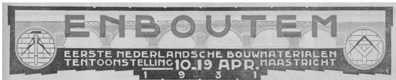
C.03 Paginahoofd zoals dat in diverse regionale kranten verscheen in het voorjaar van 1931 als reclame voor de ENTOUTEM.

uitgelezen stad voor de bouwmaterialententoonstelling. De tentoonstelling had twee locaties: de Dominicanerkerk in het centrum van de stad waar diverse interieur-gerelateerde bedrijven zich presenteerden en een locatie aan de Scharnerweg waar de wat ‘grovere’ producten werden gepresenteerd, zie de deelnemende bedrijven in de TABEL . Bij nadere beschouwing van de lijst vallen twee dingen op. Enerzijds is dit de grote hoeveelheid bedrijven die op hout en andere natuurlijke vezels gebaseerde producten aanbieden. Dit past volledig in het tijdsgewricht van de tentoonstelling waarin