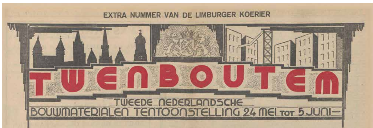
C.04 Paginahoofd van de 'beurskrant' voor de TWENBOUTEM; een extra nummer van de Limburger Koerier van 24-05-1933.