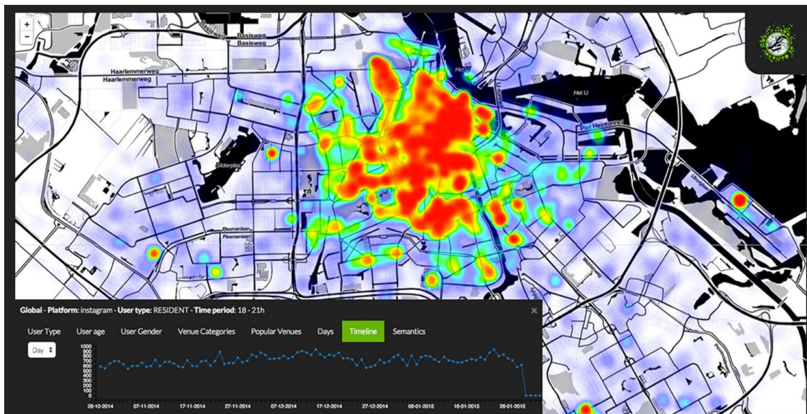
Figuur 3.2: Activiteitspatronen van Amsterdamse residenten tijdens het Amsterdam Light Festival 2015