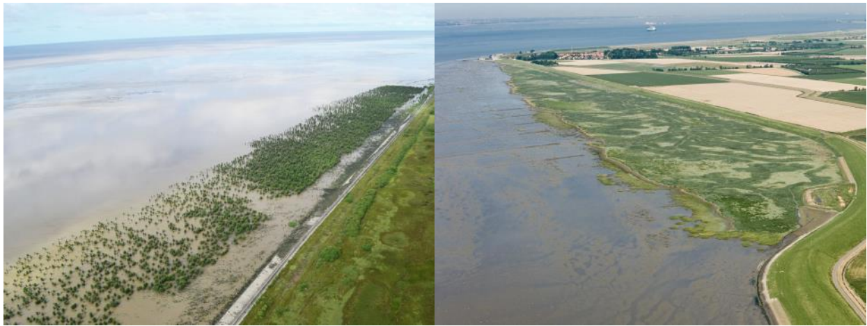
Afbeelding 2. Begroeide voorlanden: mangroves in Guyana (links, www.mangrovesgy.org ) en schorren in de Westerschelde (rechts, beeldbank Rijkswaterstaat)

Tot slot kunnen de in dit project ontwikkelde methoden ook internationaal bijdragen aan het ontwikkelen van innovatieve natuurlijke strategieën. Op veel plekken in de wereld spelen (of speelden) ecosystemen als wetlands en mangroves (Afbeelding 2) een belangrijke rol bij de kustverdediging.