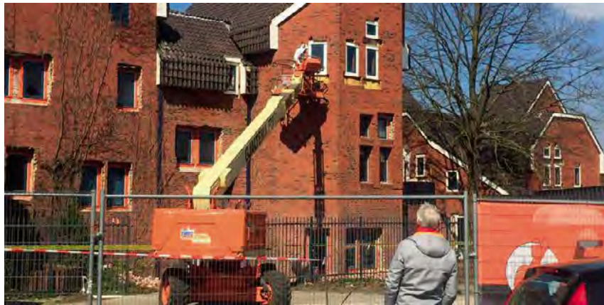
^ Илл. 9. Снос библиотеки Виншотена, построенной в 1975 году по проекту Кора Калфсбека, 2019 год (DVHN, 2019) / Fig. 9: Demolishment of the Winschoten library in 2019, designed by Cor Kalfsbeek in 1975 (DVHN, 2019)

Dutch policymakers pay sufficient attention to the generic challenges faced by small settlements and their built heritage. Effective networks that deal with research, education, practice and policymaking in this area exist. Societal changes related to the built environment produce unexpected side effects with profound but regional impacts. Four challenges are presented in this overview: induced earthquakes, the illegal production of synthetic drugs, mass tourism and the vulnerability of 1970s and 1980s community buildings as young heritage. These issues aren't easily addressed as one integral policy topic. Solutions need to be tailor-made and site-specific, and solving them has to start with the acknowledgement that small Dutch (historic) settlements face some serious big city problems.