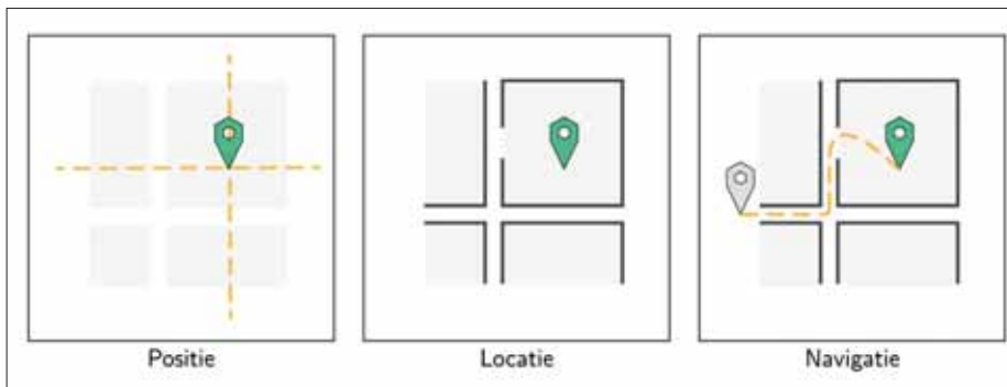
Figuur 2 - Positioneren als het vinden van coördinaten, lokaliseren als het vinden van een betekenisvolle plaats en navigeren als het bewegen naar een vastgesteld doel.

voor navigatie kan dienen, is het de locatie-informatie die een gebruiker in staat stelt een weloverwogen beslissing te maken voor het vastleggen van een nieuw navigatiedoel.