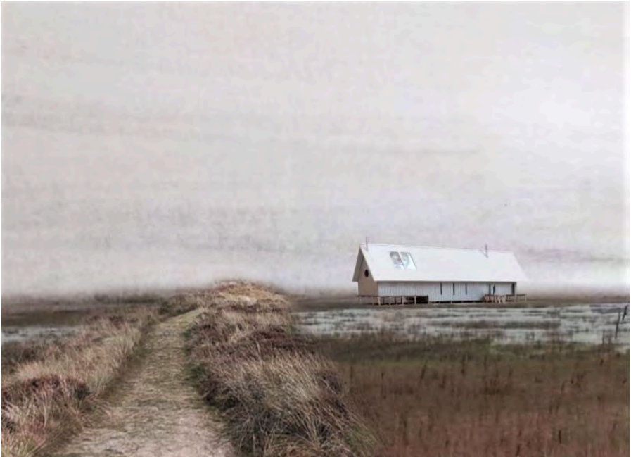
afbeelding 7.3.6 Presentatiemodel voor 'Boschplaat Cabin' (door Pjotr van Noesel voor MSc2 The Delta Shelter, gebruik met toestemming).

De verkregen inzichten tijdens het beeldend onderzoek, maakt het mogelijk om tekeningen en modellen in te zetten om ideeën – en de fysiek-ruimtelijke vertalingen daarvan, over te dragen naar externen. Het doel in deze overdracht, is het genereren van inzicht bij alle betrokken partijen in een ontwerpidee dat al dan niet gebouwd kan worden. Dit vereist het maken van bewuste keuzes over welke informatie en welke ervaring de presentatiebeelden moeten overdragen.