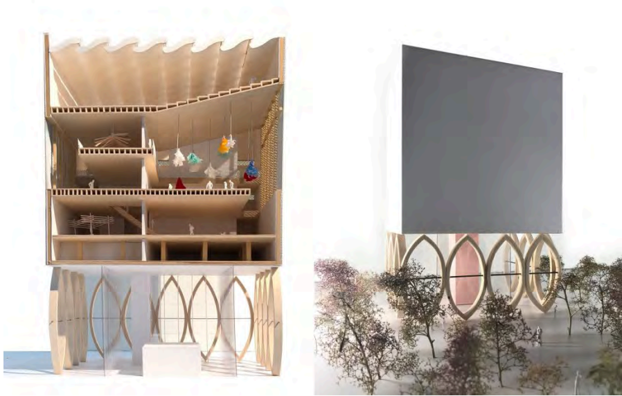
afbeelding 7.3.1a&b: Presentatiemodel van exterieur- en doorsnede van een museum (door David Holst "The Climb" voor MSc1-FSA2, gebruik met toestemming).

Kenmerkend aan de modellen die één voor één in het stadsmodel geplaatst worden is, dat zij verwijzen naar iets anders; naar een mogelijke toekomst. Het zijn beelden die ruimtelijke ideeën uitdragen en zij staan centraal in het werk van bouwkundigen. Bouwkundigen maken namelijk niet de bebouwde omgeving; ze maken verbeeldingen en beschrijvingen van ideeën die werkelijkheid kunnen worden (Groat & Wang, 2013). In tekeningen en modellen worden op visuele en fysieke wijze scenario's verbeeld die vertellen hoe ruimte in de toekomst georganiseerd, gebouwd en beleefd kan worden. Het zijn belangrijke middelen die helpen in de communicatie van ruimtelijke ideeën van ontwerpers naar de buitenwereld.