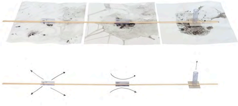
afbeelding 7.3.5 Constructief studiemodel voor de routing naar een torenkamer (door Jesse Verdoes voor MSc2 The Delta Shelter, gebruik met toestemming).

Voorafgaand aan het moment in de studio hadden de jonge ontwerpers een opgave ontvangen voor een nieuw theater aan de rand van een historisch stadshart. Dit soort opgaven kent een grote hoeveelheid eisen op pragmatisch, technisch en economisch, sociaal, cultureel, esthetisch en emotioneel vlak. De taak van bouwkundigen is deze verschillende, vaak tegengestelde, eisen te synthetiseren tot een overkoepelend idee en te vertalen naar een realiseerbaar bouwproject. In dit proces worden zij geconfronteerd met meerdere tegenstellingen die betrekking hebben op het tastbare versus het subtiele; hun intellectuele en intuïtieve kennis, de mentale en de fysieke wereld, de bestaande en toekomstige wereld en pragmatische, esthetische en emotionele eisen.