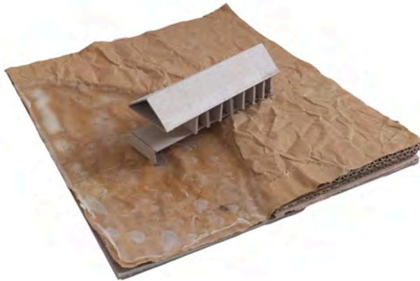
afbeelding 7.3.4 Conceptmodel voor 'Boschplaat Cabin' (door Pjotr van Noesel voor MSc2 The Delta Shelter, gebruik met toestemming).

zij 'datgene als werkelijkheid moeten beschouwen, wat alleen in een verbeelde toekomst bestaat' (Frasconi, 2007, p. 4). De tekeningen en modellen die zij maken, ontleen hun waarde grotendeels aan een zelfde dubbele werkelijkheid waarin zij zowel idee zijn als object (Healy, 2008, p. 51). Enerzijds is er de eigen werkelijkheid als model of tekening; anderzijds is er de werkelijkheid die verwijst naar iets anders – een idee over de toekomstige omgeving.