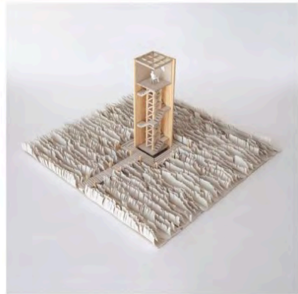
afbeelding 7.3.3: Studiemodel naar gebouwen in relatie tot het landschap en studiemodellen van een toren in het landschap (door Jesse Verdoes voor MSc2 The Delta Shelter, gebruik met toestemming).