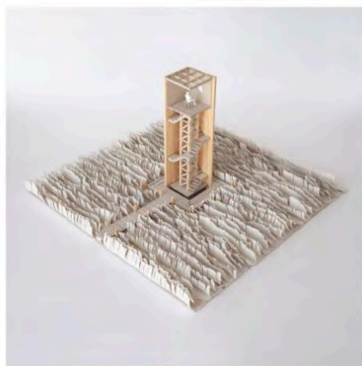
afbeelding 7.3.3: Studiemodel naar gebouwen in relatie tot het landschap en studiemodellen van een toren in het landschap (door Jesse Verdoes voor MSc2 The Delta Shelter, gebruik met toestemming).