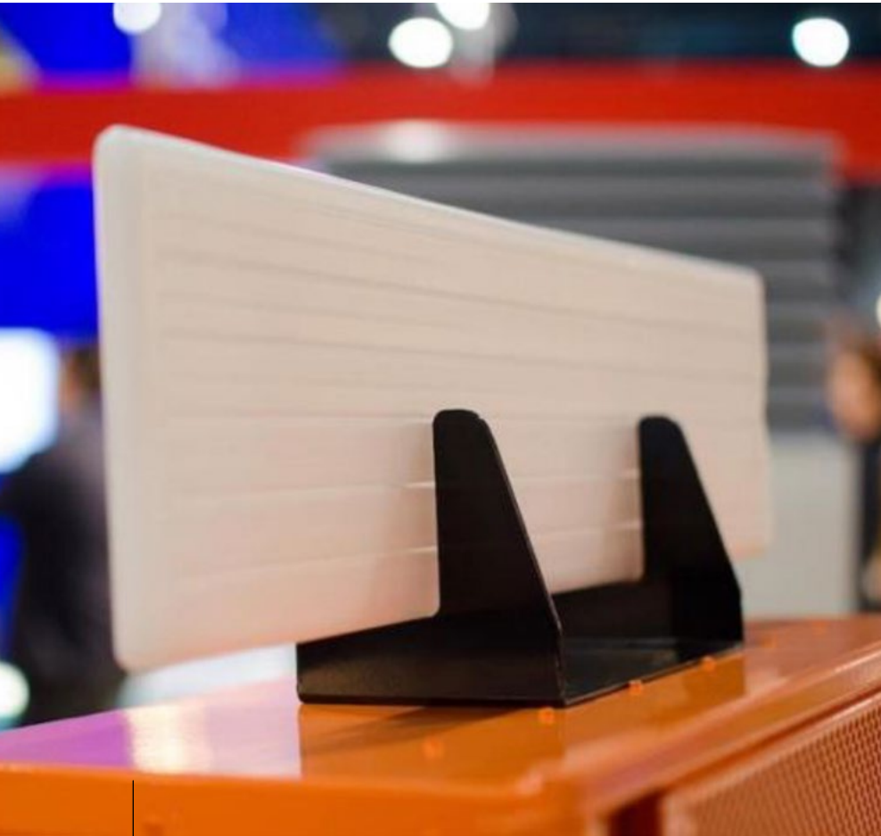
Figuur 3: CSP Panels faseovergangsmateriaal PCM Technology (Bron: C2CCertified.org).

is een eerste 'Lift as a Service' concept geleverd in Circl, het paviljoen van ABN Amro op de Zuidas in Amsterdam. Mitsubishi heeft hier haar M-Use-concept gelanceerd. Dit is een circulair model voor liften, waarbij wordt afgerekend op gebruik in plaats van een traditionele aanschaf en onderhoudsabonnement. Dit 'product as a service'-model voorkomt hoge investeringskosten voor de klant én hergebruik en recycling staan daarbij